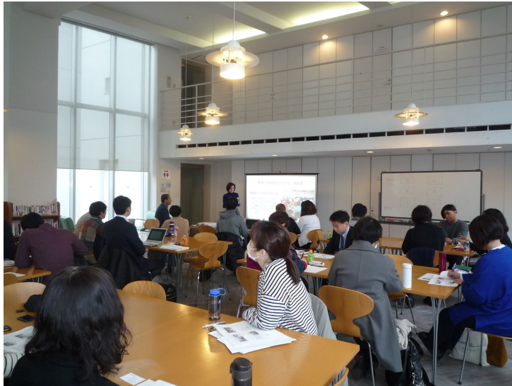
2020年1月25日に成蹊大学で行われたシンポジウムの様子